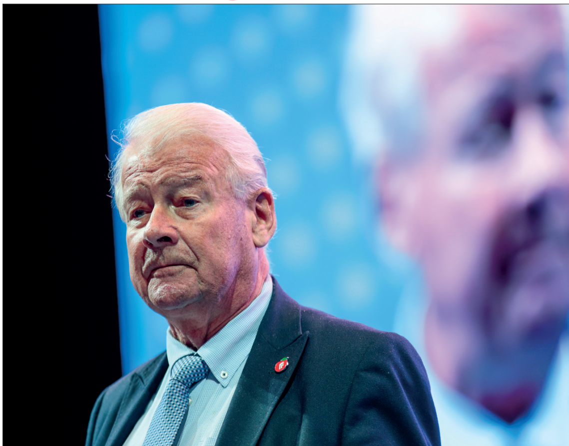
KONTROLL AV MAKTEN: Tidligere FrP-leder Carl I. Hagen (80) har hatt mange politiske verv og kom inn på Stortinget for første gang i 1974. Interessen for Stortingets tredje oppgave, den kontrollerende forsamling, har vært der siden da.

– Kontrollsystemet skal sørge for at folk gjør en god jobb, og ikke faller for fristelsen til